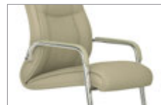
Brazos con apliques tapizados. Braços amb detall entapissat / Accoudoirs avec manchettes tapissées / Upholstered armrest / Gepolsterte Armauflage