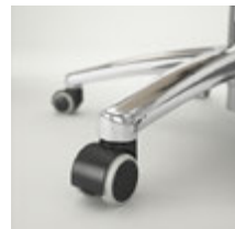
Ruedas dobles Ø 50 mm Rodes dobles Ø 50 mm / Roulettes doubles Ø 50 mm / Double wheels Ø 50 mm / Doppelaufrollen Ø 50 mm.