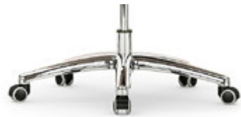
Base en aluminio pulido Base en alumini polit / Base en aluminium poli / Polished aluminium base / Fußkreuz Aluminium poliert.