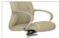
Brazos con apliques tapizados. Braços amb detall entapissat / Accoudoirs avec manchettes tapissées / Upholstered armrest / Gepolsterte Armauflage