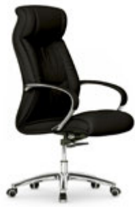
Silla de dirección. Cadeira de direcció / Siège de direction / Executive chair / Chefessel.