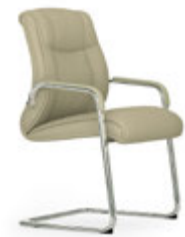
Estructura cromada. Estructura cromada / Structure chromée / Chrome frame / Gestell Verchromtes.