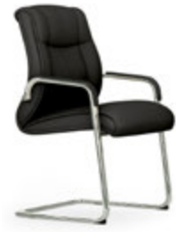
Balancín. Confident / Luge / Cantilever / Freischwinger.