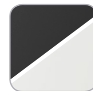
Estructura respaldo polipropileno negro o blanco / Estructura respallier en polipropilé negra o blanc. / Structure du dossier en polypropylène noir ou blanc. / Backrest frame available in black or white polypropylene. / Rückenlehne Gestell in schwarz oder weiß Polypropylen.